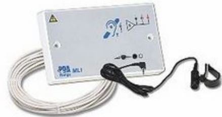
A GS-I 3F cikkszámú hurokerősítő mikrofonnal és hurokkábellel.